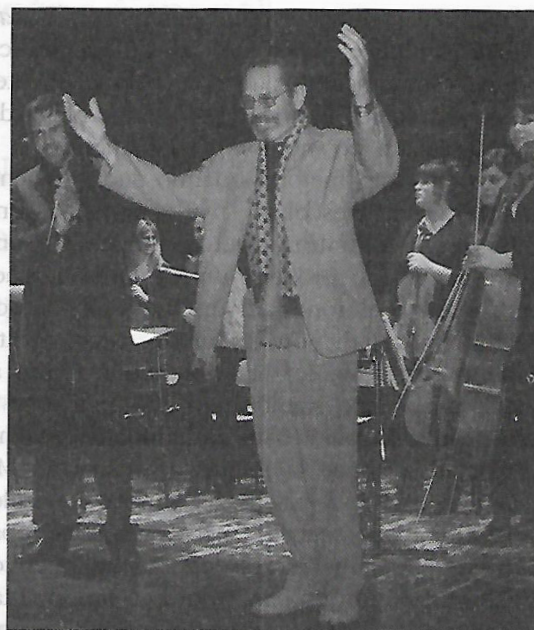
Latina, 1° marzo 2008: Leo Brouwer saluta il pubblico alla fine del concerto

◀ Questo è interessante. L'elemento maggiore, più importante e difficile, è il senso di temporalità. La concezione di temporalità rispetto al suono si è trasformata con la vita odierna. Ho affermato più volte che all'epoca di Wagner, alla fine dell'Ottocento, il tempo di concentrazione si aggirava approssimativamente attorno ai 45 minuti; negli anni Cinquanta attorno ai 6-7 minuti; negli anni Settanta-Ottanta era scesa a 3 minuti; oggi, presumibilmente, si aggira attorno a un solo minuto. Dopo un minuto, infatti, cominciamo a muoverci sulla sedia, a guardare l'orologio, prendiamo il cellulare per fare una telefonata... Allo stesso tempo esiste un fattore importante: l'uomo è obbligato a concentrare in pochissimo tempo una quantità enorme di elementi, di sensazioni, di analisi, di soluzioni, di risposte. Tutto ciò ha subito una brusca accelerazione. L'esempio più chiaro è il videoclip , che